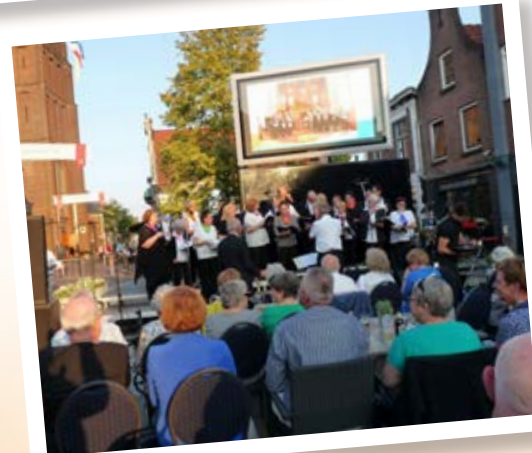
Am 22. Juni 2019, dem Vorabend der Boxmeerse Vaart, nahm der Kirchenchor Weeze am Open-Air-Konzert in Boxmeer (NL) teil.