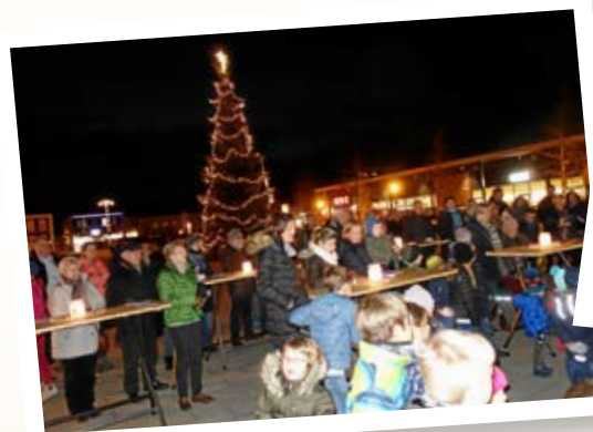
Am 12.12.2018 öffnete das erste Adventsfenster am Weezer Rathaus. Ein weiteres Fenster war am 19.12.2018 in Wemb am Kindergarten Kieselstein gestaltet.