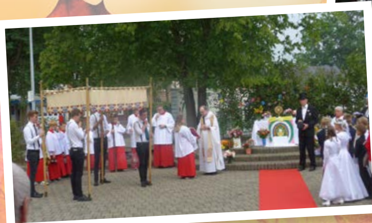
Die Fronleichnamsaltäre an der Petrus-Canisius-Schule und am Theresienstift.