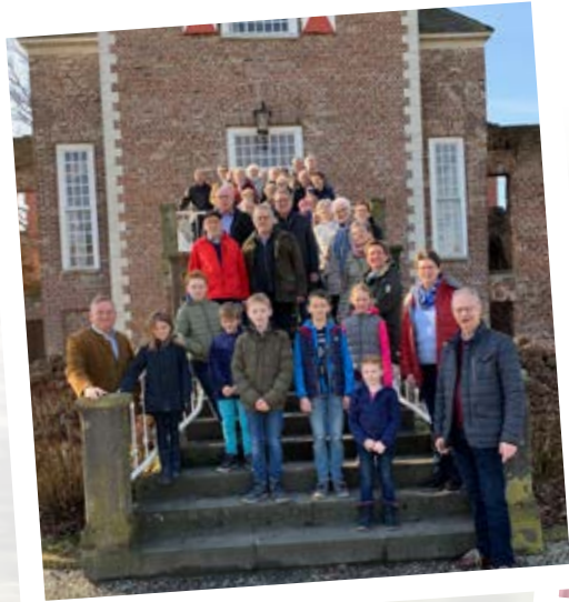
Besichtigung Schloss Hertefeld