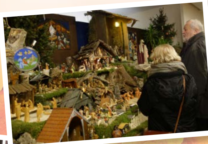
Vom 06.01. bis 10.01.2019 ging die mehrtägige Krippenfahrt ins Eichsfeld mit Standort Heiligenstadt.