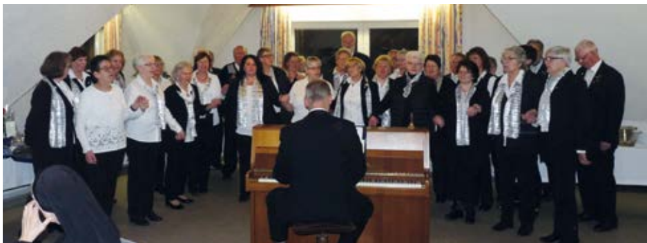
Beim Cäcilienfest erfreut der Chor seine Gäste mit Gesang

Der Kirchenchor St. Cyriacus ist ein wichtiger Bestandteil im Kirchenleben von St. Cyriacus, insbesondere bei bedeutenden Kirchenfesten. Außerdem gehörten die inzwischen fest eingeplante Mitwirkung beim Benefizkonzert des Landespolizeiorchesters am 19. Mai 2019 sowie der Chorauftritt am Vorabend der Boxmeerse Vaart am 22. Juni 2019 dazu. Auch die gesangliche Mitgestaltung des Eröffnungsgottesdienstes am Kirchmessamstag war in diesem Jahr wieder angesagt. Zu einer lieben Tradition ist auch das Adventssingen im Theresienstift, in diesem Jahr am 08. Dezember , geworden.