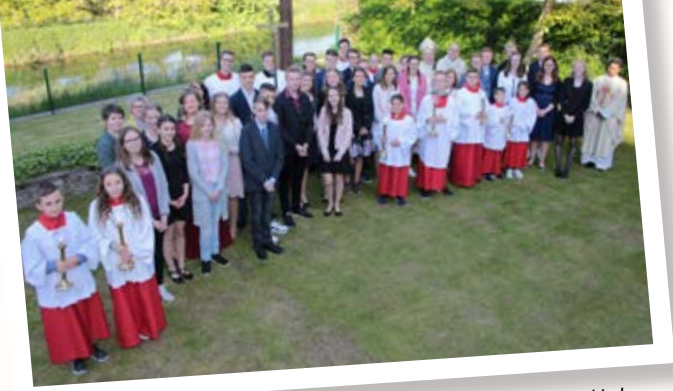
Am 11. Mai 2019 spendete Weihbischof Wilfried Theising in der Pfarrkirche St. Cyriakus die Firmung.