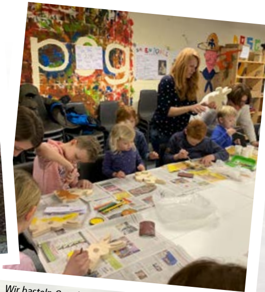
Wir basteln Osterhasen