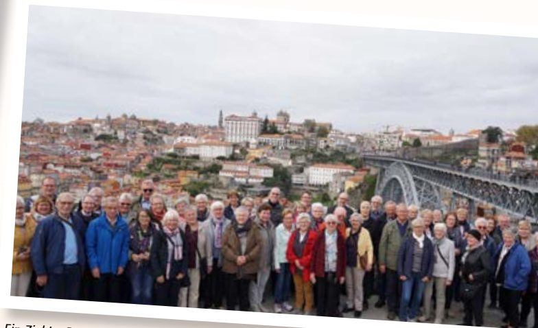
Ein Ziel im Rahmen der Pilgerreise nach Fatima vom 11. bis 22. Oktober 2019 war Porto, wo dieses Gruppenfoto gemacht wurde.