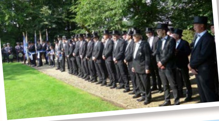
Am 15. Juni 2019 hielt die St. Johannes-Schützenbruderschaft Weeze ihr Königsvogelschießen ab.