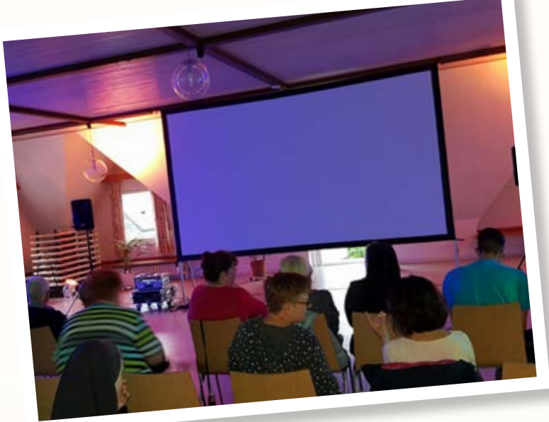
Regelmäßiges Angebot des Pfarreirats ist „Kino in der Kirche“, hier am 12. Juli 2019.