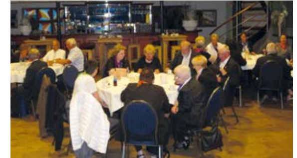
Nach dem Auftritt in Boxmeer in diesem Jahr

Beim jährlichen Cäcilienfest, zusammen mit den Partnern, Pensionären und geladenen Gästen, das in diesem Jahr am 23. November stattfinden wird, sorgen nach dem Festessen im Pfarrsaal lustige Gruppen- und Einzeldarbietungen für weitere Unterhaltung.