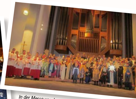
In der Messe vor dem Neujahrsempfang am 05.01.2019 erfolgte die „Rückkehr“ aller Sternsinger aus Weeze und Wemb in die Pfarrkirche St. Cyriacus.