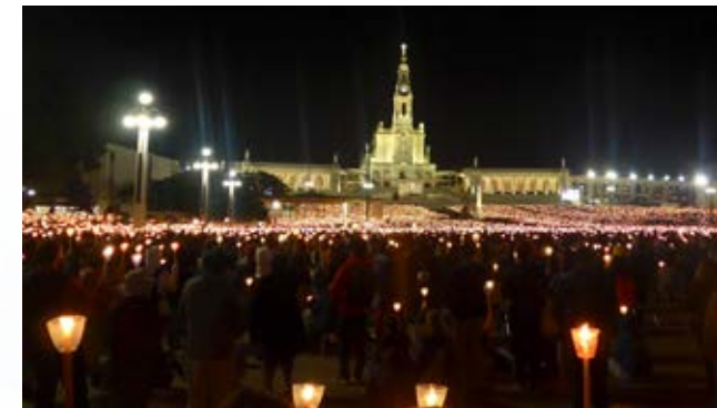
Lichterprozession am Samstag mit zigtausenden Pilgern