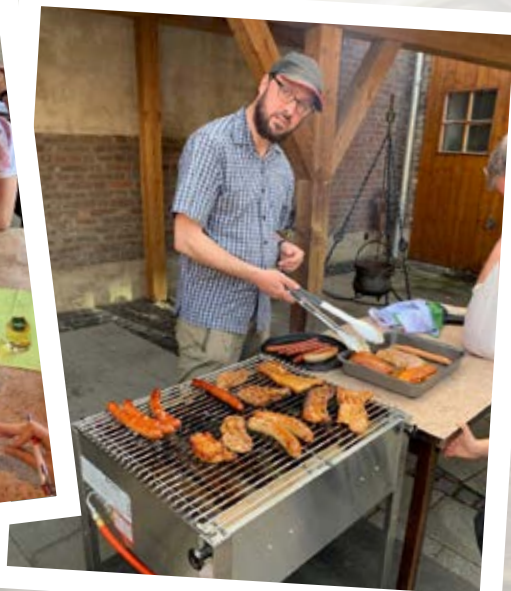
... und auch das gehört dazu