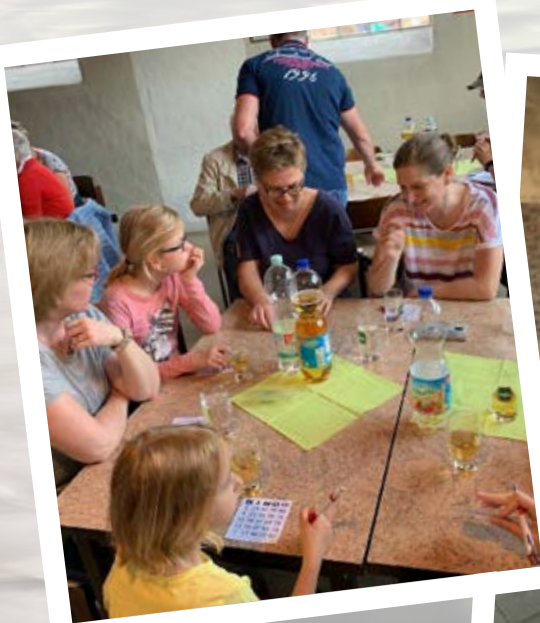
Spielnachmittag mit Groß und Klein