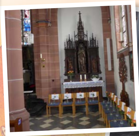
Zum Gedenken der seit dem letzten Allerheiligentag Verstorbenen wurden in den Kirchen St. Cyriakus und Heilig Kreuz Stühle mit ihren Namen, einer Rose und einer Kerze aufgestellt.