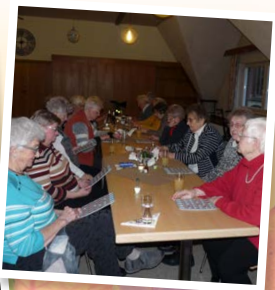
Regelmäßig trifft sich die Ü 60 im Pfarrheim.