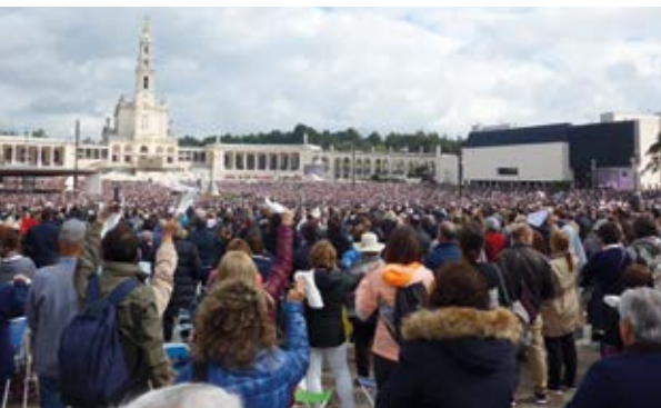
Messe am Sonntag

Am Samstagabend, 12. Oktober 2019, hatten sich zigtausende Pilger auf dem großen Platz vor der Basilika in Fatima versammelt, um gemeinsam den Rosenkranz in verschiedenen Sprachen zu beten. Danach wurde die Madonnenstatue in einer Lichterprozession, begleitet von vielen Priestern und Pilgern, durch die Menge mit den brennenden Kerzen um den großen Platz getragen. Der Refrain des Fatima-Liedes, Ave, Ave, Ave Maria ... vereinte sich zu einem riesigen vielstimmigen Choral.