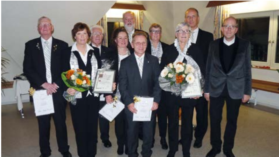
Ehrungen und Neuaufnahmen beim Cäcilienfest 2018

Der Kirchenchor St. Cyriacus ist ein wichtiger Bestandteil im Kirchenleben von St. Cyriacus, insbesondere bei bedeutenden Kirchenfesten. Außerdem gehörten die inzwischen fest eingeplante Mitwirkung beim Benefizkonzert des Landespolizeiorchesters am 19. Mai 2019 sowie der Chorauftritt am Vorabend der Boxmeerse Vaart am 22. Juni 2019 dazu. Auch die gesangliche Mitgestaltung des Eröffnungsgottesdienstes am Kirchmessamstag war in diesem Jahr wieder angesagt. Zu einer lieben Tradition ist auch das Adventssingen im Theresienstift, in diesem Jahr am 08. Dezember , geworden.